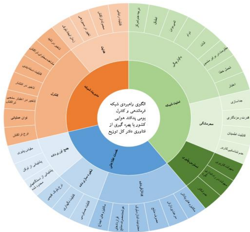
شکل ۱: الگوی راهبردی شبکه فرماندهی و کنترل پدافند هوایی با بهره‌گیری از فناوری دفتر کل توزیع شده

با توجه به نتایج حاصل از مرحله کیفی تحقیق، ابعاد، مؤلفه‌ها و شاخص‌های الگوی راهبردی تحقیق به تعداد ۳ بُعد، ۸ مؤلفه و ۳۸ شاخص مشخص گردید. الگوی نهایی در شکل ۱ نشان داده شده است.