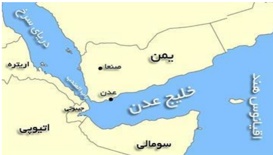
شکل شماره (۱): کشورهای حوزه خلیج عدن

وجود بعضی جزایر با ویژگی‌های راهبردی بر اهمیت آنها می‌افزاید، افزون‌بر جزیره «بریم» جزیره «زقر» که در فاصله ۲۹ کیلومتری یمن قرار دارد و بلندترین نقطه آن ۶۵۲ متر از سطح دریا ارتفاع دارد، امکان واپایش و مراقبت فعالیت‌های دریایی آن منطقه را مسیر می‌سازد.