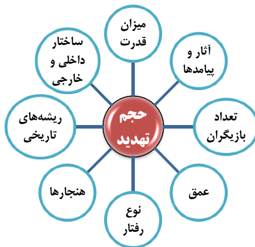
شکل شماره (۲): متغیرهای مؤثر در حجم تهدید (افتخاری، ۱۳۸۵: ۶۶-۵۲)